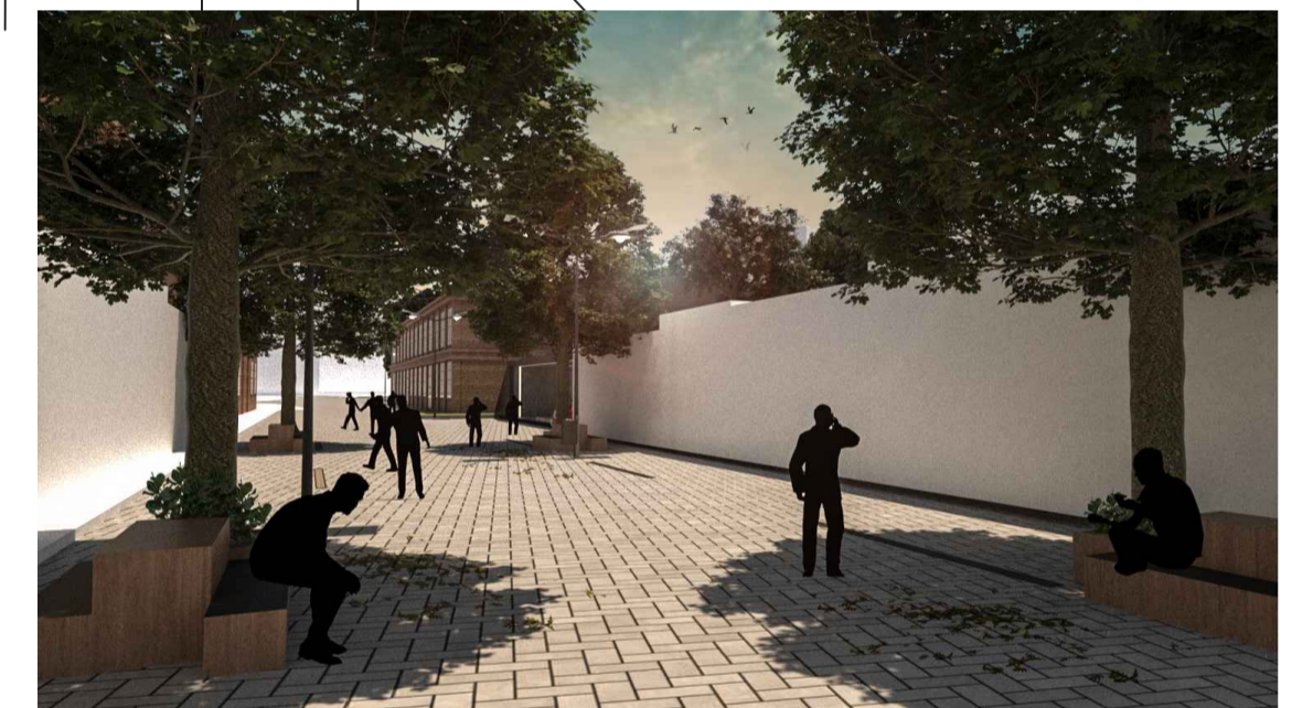
RUA PAULO DE FRONTIN, PRIORITARIAMENTE PEDONAL, APENAS ACESSO VEÍCULOS SERVIÇO E MORADORES