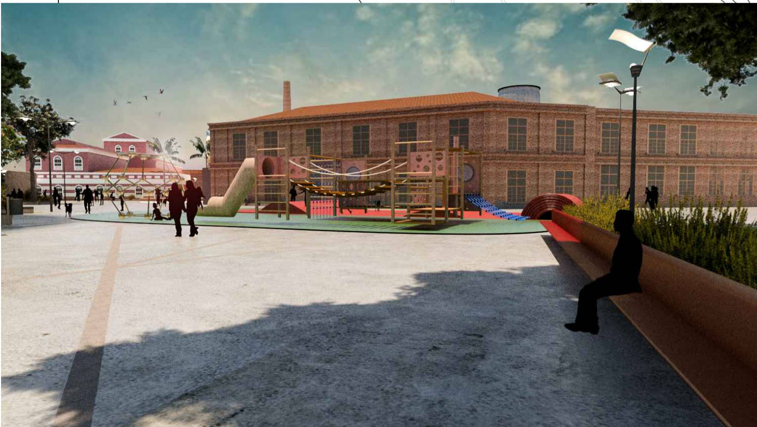
VISTA DO PARQUEINHO INFANTIL E BANCO NA PRAÇA ANTONIO CARLOS