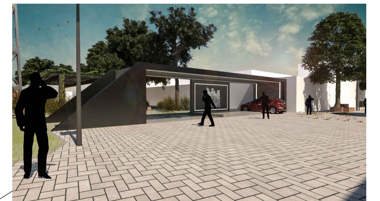
PÓRICO ENTRADA RUA PAULO DE FRONTIN - PROPOSTA PROJETO